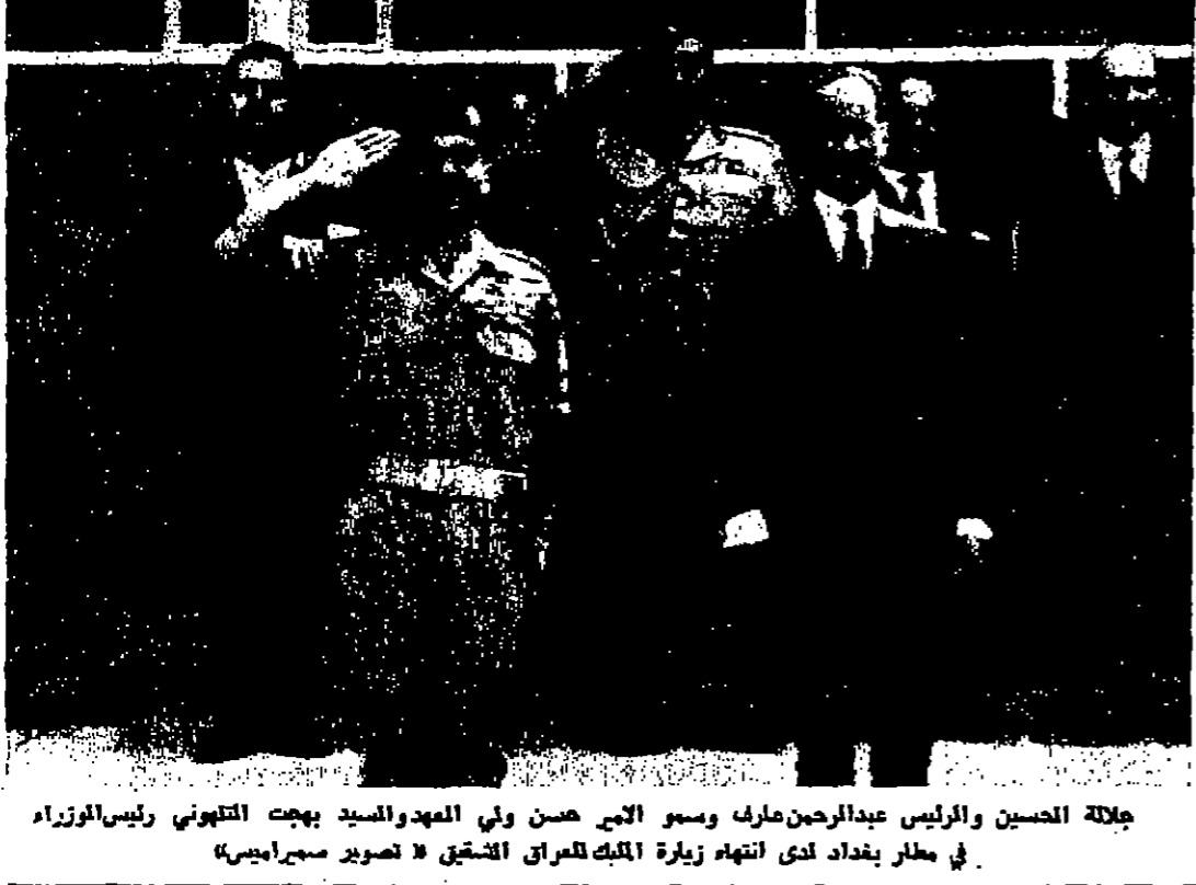
جلالة الحسين والرئيس عبدالرحمن مارف ومسوا البحر حسن ولي العهد السيد بهجت التتويهي رئيس الوزراء في مطار بغداد لدى انتهاء زيارة الملك للمران الشقيق

اجتماع ثلثي في الرياض بين الحسين وقبيل وأحسن الثاني الرياض - اصدرت وزارة الخارجية المغربية بياناً اعلنت فيه ان جلالة الملك الحسين عامل الأردن سيحضر في جلالته الملك الحسن الثاني عامل المغرب في الرياض يوم الأحد القادم. اقيمت على الصفحة السادسة عمود ٥